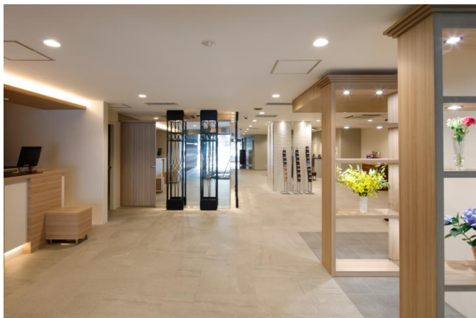
フロント・ロビー

会議室や大部屋があった2階と11階には新たに客室が新設され、総部屋数が150室から164室となりました。その他、デラックスツインを新設し、ビジネスのお客様のみならず、インバウンドや観光レジャーのお客様にもご利用いただきやすくなりました。また、ホテルの近隣には横浜スタジアムや横浜文化体育館などのスポーツ施設が充実していることから、スポーツ団体や近年増加傾向にある企業の研修旅行など、団体のお客様のご利用も積極的に取り込んでまいります。