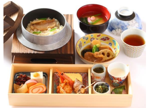
朝食「北陸づくしの釜めし御膳」

旅の楽しみのひとつでもある“食”にもこだわり、ノドグロや蟹、タケノコなど金沢の旬を感じる食材と「ひやくまん穀」（石川県オリジナル米）で炊いた釜めしをメインに加賀野菜や、じわもん（地のもの）を使った煮物やおぼんざい、香物、汁物をセットにした朝食「北陸づくしの釜めし御膳」もご用意しております。