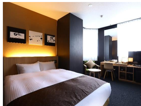
デラックスダブル