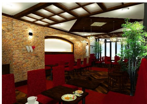
レストランイメージ

出張や旅の楽しみのひとつでもある“食”にもこだわりました。「Daybreak (デイブレイク)」～赤羽という街の活力をその日の活力に～という思いを込め、パワーが出るような食事を和と洋の2種類からお選びいただけるワンプレートでご提供いたします。