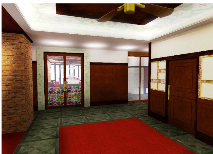
エントランス・ロビー

当ホテルは「人気の穴場タウンに佇む安らぎホテル」をコンセプトに現代を生きる大人を応援する隠れ家のような雰囲気のホテルを目指します。