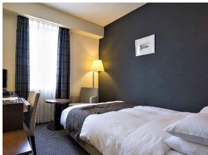
セミダブルルーム