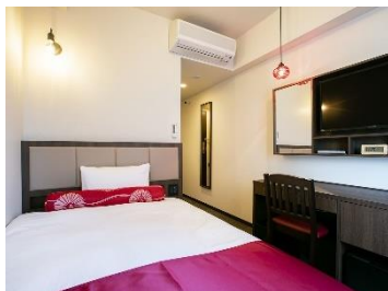
スタンダードシングル

客室は1名様利用に便利な「シングル」「セミダブル」「ダブル」をメインに、観光にもご利用いただける「ツインルーム」「トリプルルーム」もございます。ふわりと柔らかな寝心地の寝具のほか、全室ナノイー空気清浄機完備/Wi-Fi 接続無料となっています。