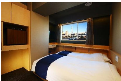
ビューツインルーム