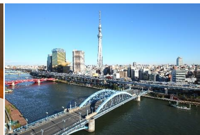
展望テラスからの眺望

プラン名：【記念日/夕食付】腕利きシェフが贈る Wine & Dining EKA オリジナルディナーコース付き