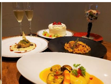
ディナーコース（イメージ）