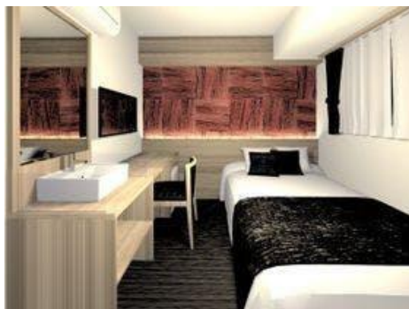
スタンダードダブルルーム

全室ナノイー空気清浄機完備 / Wi-Fi接続無料 / 全室禁煙 / 全室バス・トイレ・洗面台独立