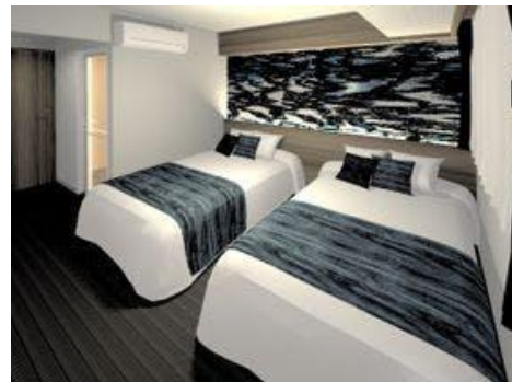
スタンダードツインルーム