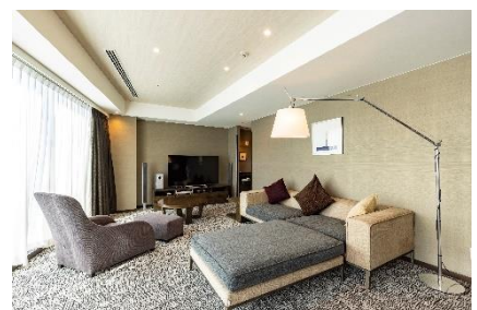
デラックススイート