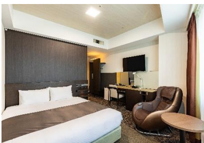
スタンダードクイーン