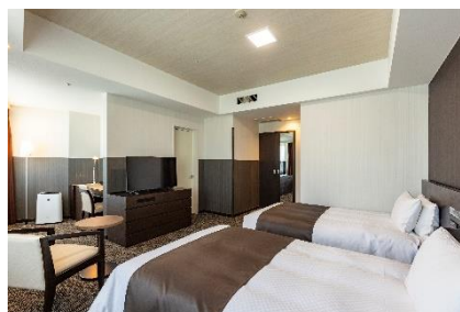
スーペリアツイン