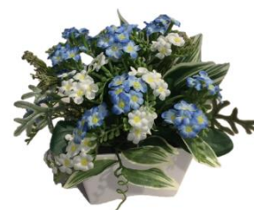
アーティシャルフラワー