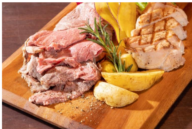
(ローストビーフ 盛り付けイメージ)

※姉妹レストラン「Trattoria W」(仙台店)でも同じ食べ放題フェアを開催します。曜日や開催期間はWEBサイトでご確認ください。なおLINE特典はございません。 https://www.tenzahotels.jp/sendai/