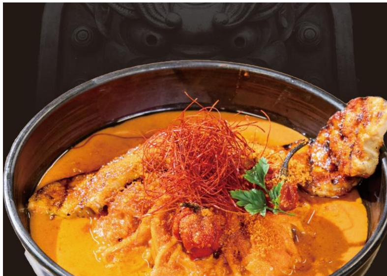
激辛チャレンジメニュー「辛暴ナーラ」（カラボナーラ）

WEB サイト： https://www.hotelwing.co.jp/yotsuya/restaurant/