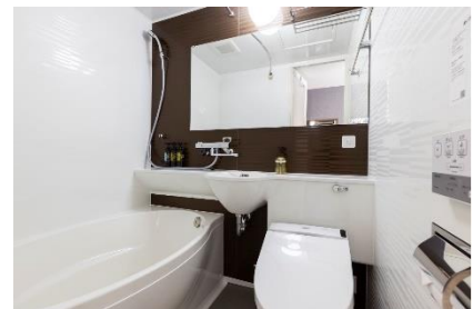
ユニットバス (スタンダード)