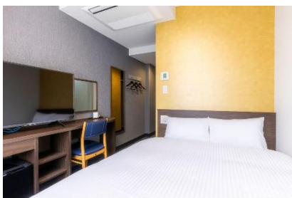
スタンダードシングル/ダブル

おひとり様のご利用に最適なスタンダードダブルから、エキストラベッドを入れて3名利用が可能なデラックスツイン、最大10名までお泊りいただけるフォースルームまで様々な客室タイプがございます。