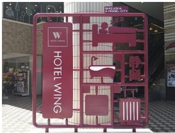
プラモニュメント