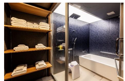
フォースルームのバスルーム