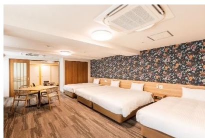
最大10名までお泊りいただけるフォースルーム