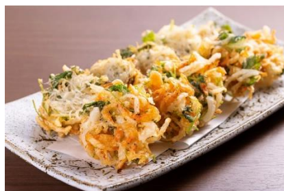
桜エビのかき揚げ