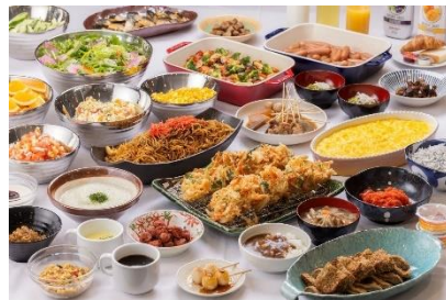
朝食ビュッフェ イメージ