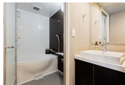
3点独立の水廻り (デラックス)