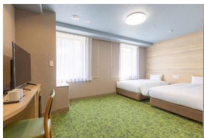
デラックスツイン