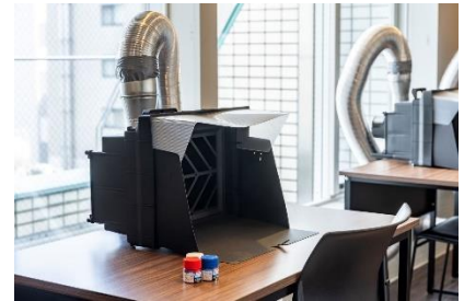
プラモデルブース