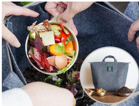
大型コンポストバッグ