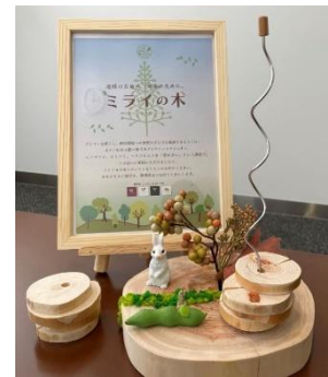
ミライの木プロジェクト