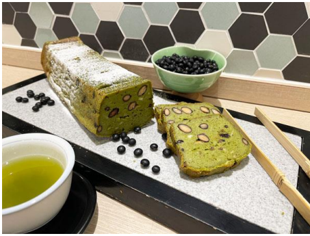
フードロス削減メニュー